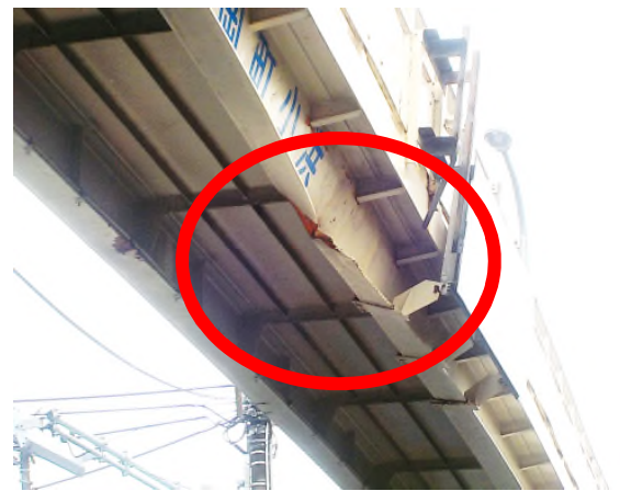
歩道橋上部工の一時撤去状況<R2.4.22夜>