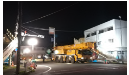
▲歩道橋撤去完了!!!<階段部のみ残っています>