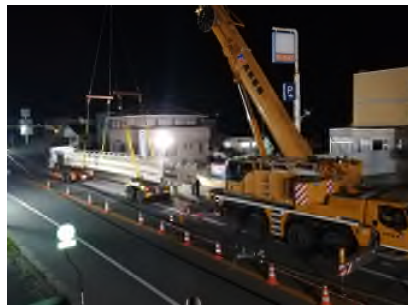
▲撤去した歩道橋をトレーラーに積み込み!