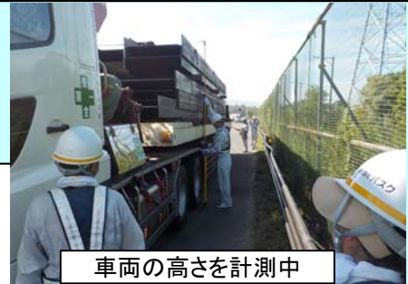
車両の高さを計測中