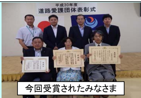
今回受賞されたみなさま