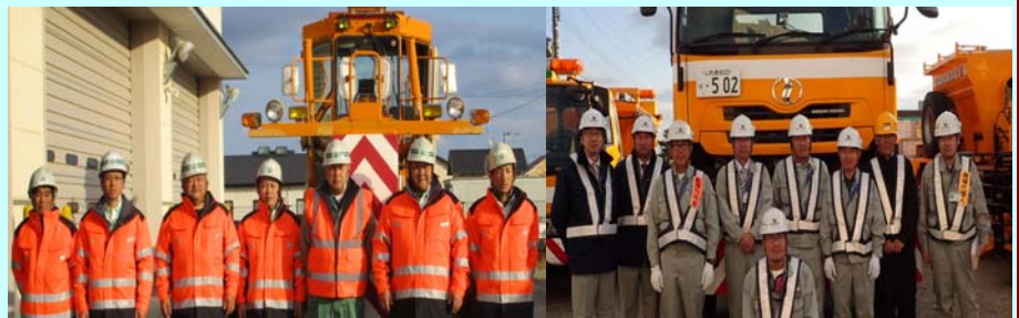
▲除雪作業を行う作業員の方々