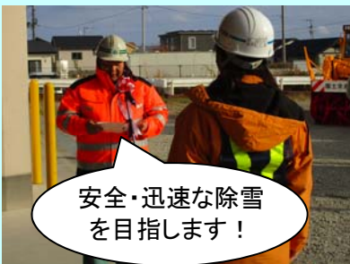
安全・迅速な除雪を目指します！