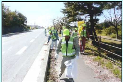
10月13日(土)に清掃活動を実施していただいた福島県トラック協会相双支部の皆さん

清掃後の道路を利用したドライバーや歩行者の皆さんも、いつもより気持ちよく道路を利用できたことと思います。