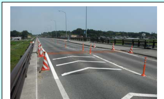
現在、応急復旧段階である工事箇所②「相馬東大橋」の段差を解消します。