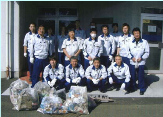
シチズン東北(株)相双事業所

シチズン東北(株)相馬事業所(新地町)安全衛生委員会の皆さん、(社)福島県トラック協会相双支部(相馬市)の会員の皆さんにより、国道6号沿道のゴミ拾いをさせていただきました。 休日の貴重な時間に汗を流しゴミ拾いをさせていただき大変ありがとうございました。