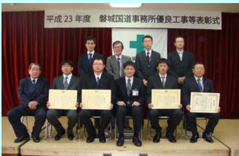
▲表彰を受けられた請負業者の皆さん