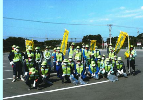
(社)福島県トラック協会相双支部

年末に予定している2回目の美化活動では社員総出でゴミ拾いを計画しているということです。