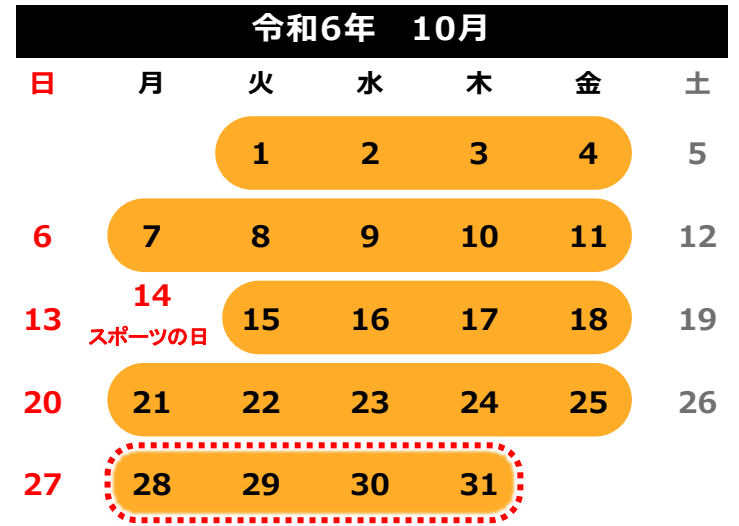
▼エコ通勤実施期間