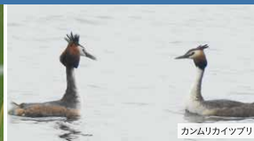
カムリカイツブリ

仏沼は国内でも最大のオオセッカの繁殖地となっており、小川原湖や周辺の湖沼群は、日本有数のカムリカイツブリの繁殖地になっています。