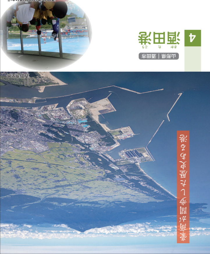
豪商間歩歴史たしつるの湖