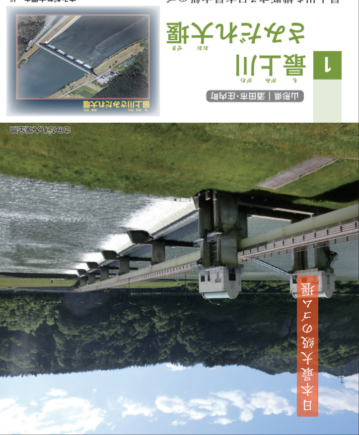
日本最大規模の堰