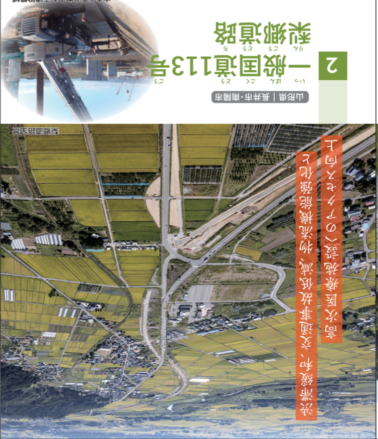
高規格道路(一般国道113号)の施設強化、交通事事故低減、物流機能強化