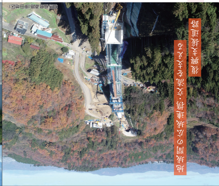
地域間の交流を促進する 復興支援道路