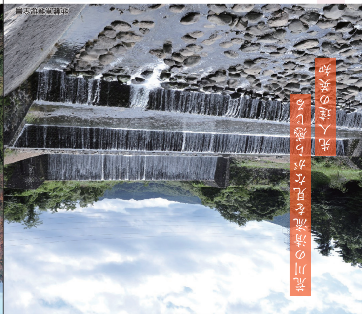
荒川の清流を見ええ 先人の美の達人を知