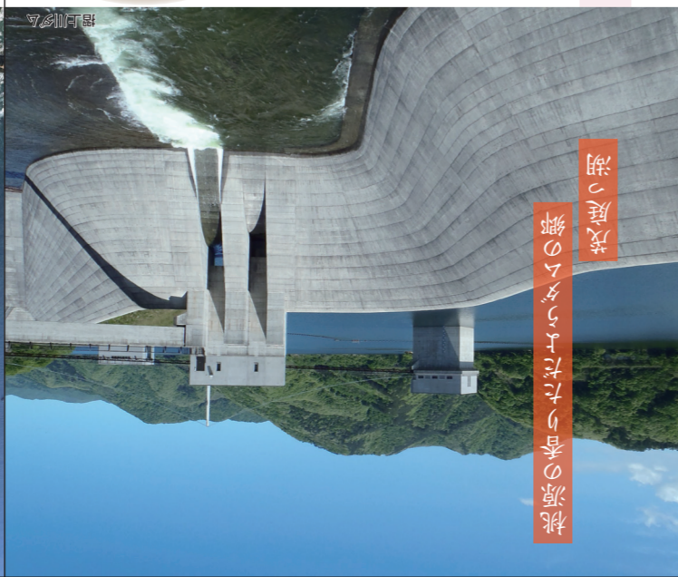
桃源湖への流入 響のダムに注ぎ込まれる