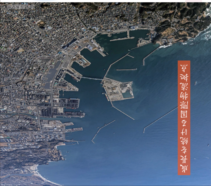
成長を続ける国際物流拠点