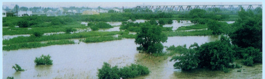
▲ 三川橋より下流を望む (赤川/鶴岡市大宝寺地区/平成2年6月27日)