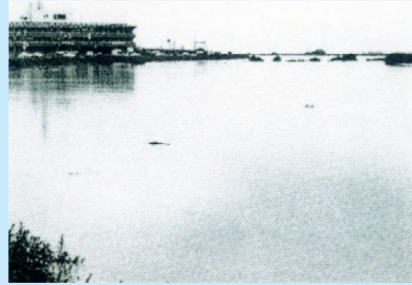
▲ 庄内支庁付近の浸水状況 (赤川/三川町押切地内/昭和62年8月29日)