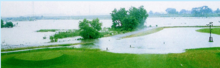
◀ 河川敷ゴルフ場の浸水状況 (赤川/鶴岡市我老地区/平成2年6月27日)