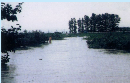
▲ 増水の状況 (赤川/三川町横山地区/平成2年6月27日)