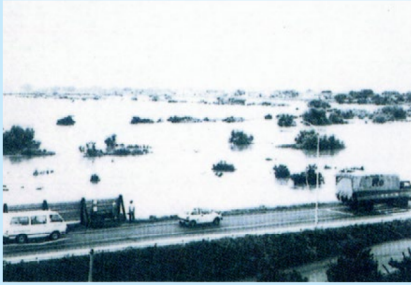
▲ 庄内支庁付近の浸水状況 (赤川/三川町/昭和62年8月29日)