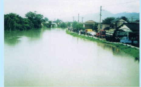
▲ 増水状態が続き不安そうな住民と待機する消防団 (新内川と内川の合流地点/鶴岡市鳥居町地内/昭和62年8月29日)