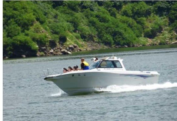
あさひ月山湖見学（ボート巡視体験）

今年もダムの中にある大規模なゲート設備を間近で見ることができる「月山ダム堤体内見学」やボートに乗ってダム湖の巡視を体験する「あさひ月山湖見学」など、様々な催しを用意しております。たくさんの方々の来場をお待ちしております。