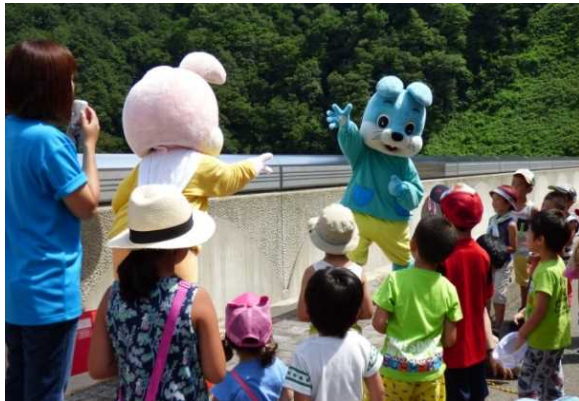
月山ダムジャンケン大会