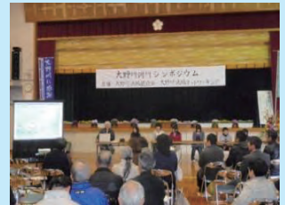
シンポジウムの開催