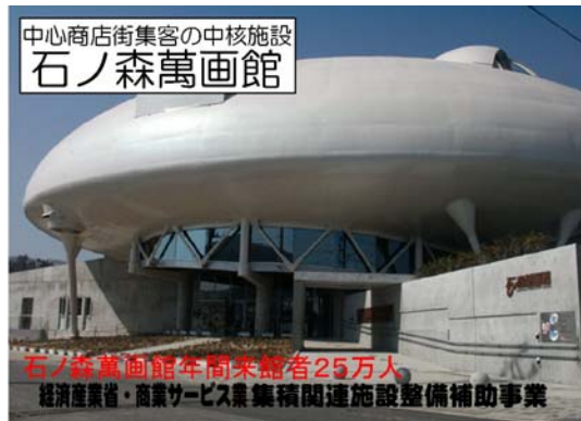
年間約25万人が訪れており、中心市街地の補助事業の中でも評価が高い。