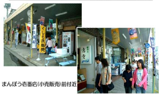
まんぼう番店(小売販売)前付近