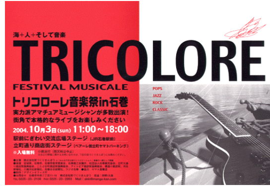
若者が集まれる行事として、トリコローレ音楽祭を初めて開催した。