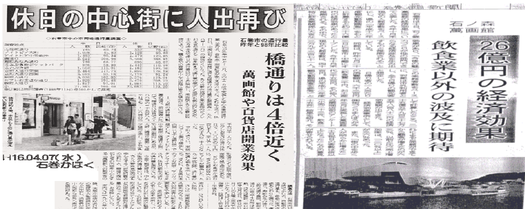
石巻市としてはハード面の整備は進んでおり、イベント等の小さな工夫から中心市街地の活性化を図ろうとしている。