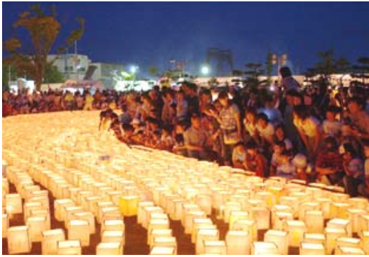
市内小中学校とPTAが約5千人参加する夏の風物詩となっている灯籠流しが行われている。