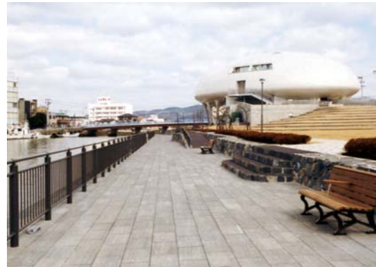
国土交通省と石巻市により水辺ゾーンとして漫画館と一体的に整備されている。