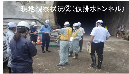
現地視察状況②(仮排水トンネル)