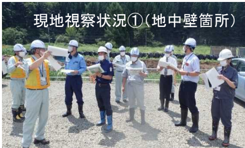
現地視察状況①(地中壁箇所)