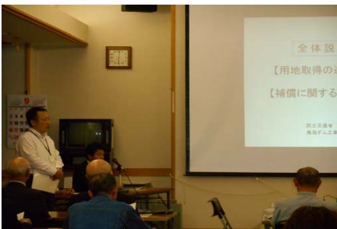
市民交流学習センターにおける用地課職員による説明の様子