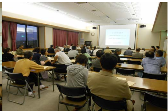
説明を聞く本荘地区地権者の方々

「鳥海ダム生活再建相談所」を下記の2箇所で開設しております。 相続や税金のことなど、お気軽にご利用下さい。