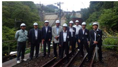
ダム工事現場見学参加者で記念撮影