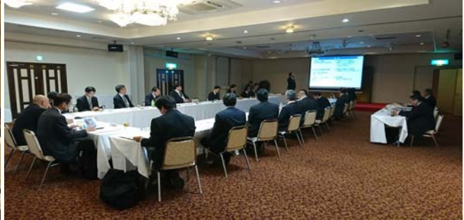
説明を聞く委員の方々