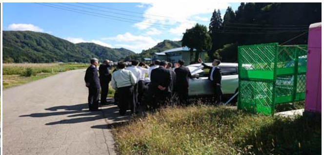
皆様、鳥海ダムの建設現場予定地に興味を持っていました