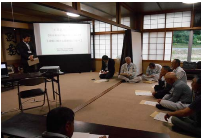
鳥海防雪センターでの説明の様子(瀬野副所長挨拶)