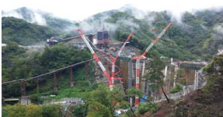
建設中のハッ場ダム(展望箇所より)