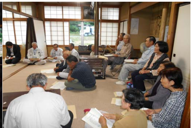
説明を聞く百宅地区地権者の方々