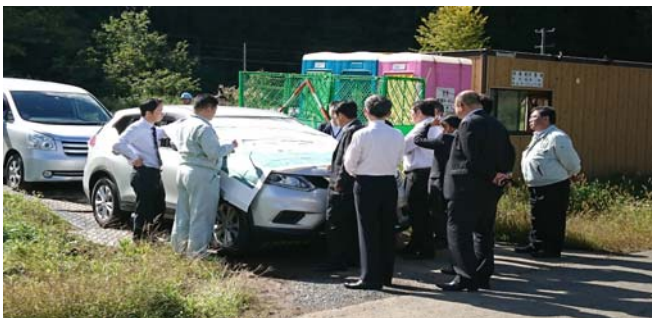
現地での図面による説明