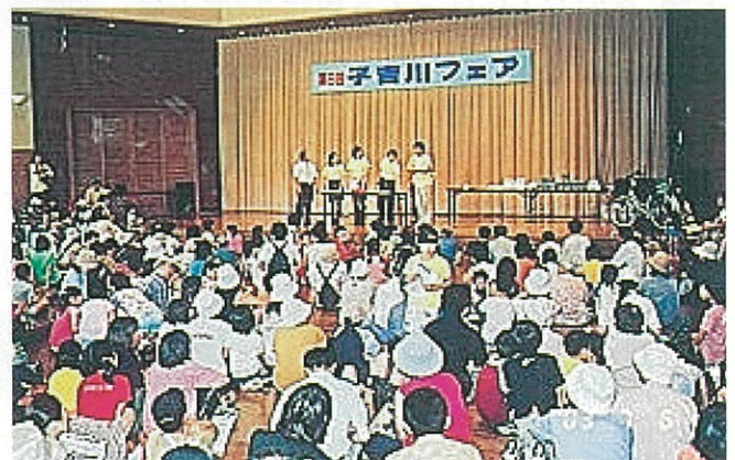
ラッキープレゼント