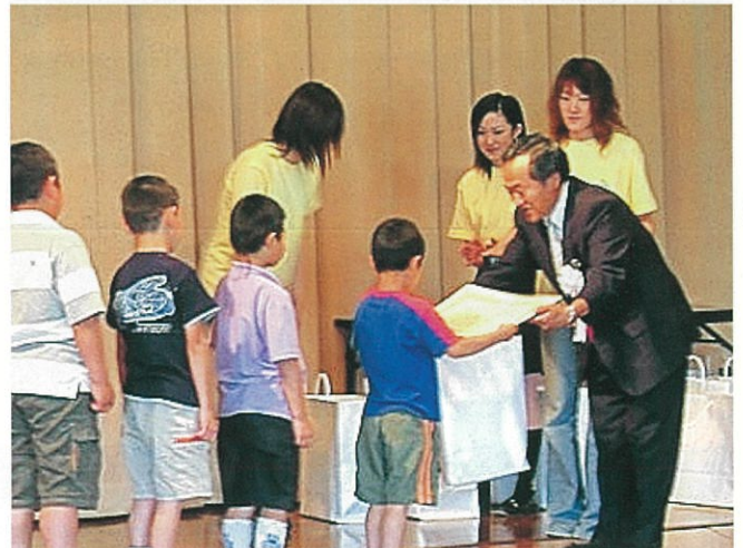
「標語・絵画」表彰式

アクアパル館内周辺においては、「パネル・写真展示コーナー」、「各市町村物産コーナー」、「フリーマーケット」、「魚のつかみどり大会」などが行われ、暑い中、多くの人々が訪れ、会場を賑わせました。