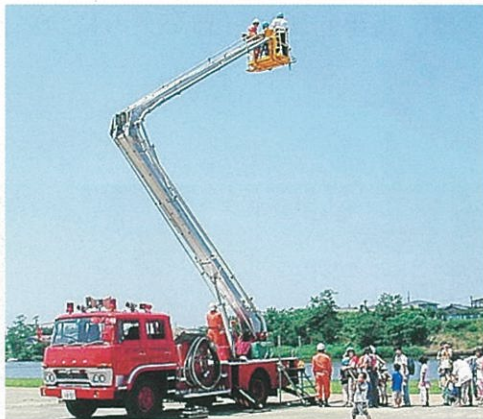
消防ふれあい広場