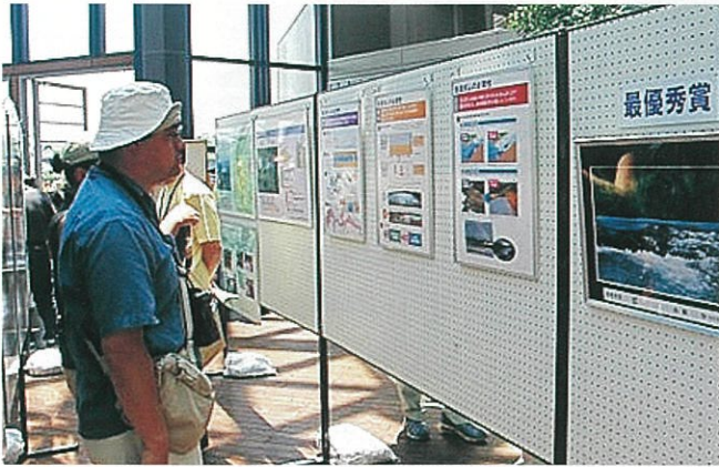
パネル・写真展示コーナー