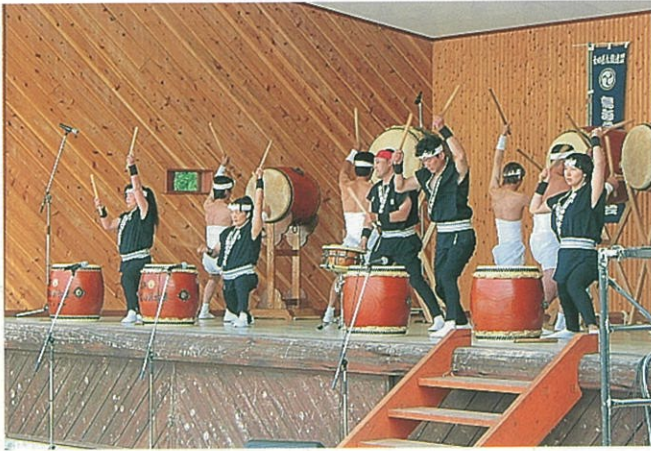
鳥海前ノ沢太鼓で幕開け

6月8日、鳥海町「健康広場」において、好天のもと、鳥海町主催の新緑まつりが開催されました。新緑まつりは、勇壮な「鳥海前ノ沢太鼓」で幕開けされた後、各種イベントが行われました。毎年恒例の百宅そば早喰い大会は男女各15名により競われ、他の出場者を引き離す好タイムで優勝が決まりました。また、今年から企画された豪華賞品が当たる「さなぶり大抽選会」が盛大に行われました。なお、当所でも会場の一角に鳥海ダムコーナーを開設し、鳥海ダムのPRを行いました。