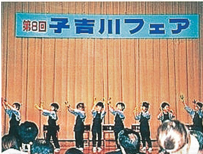
内越元気太鼓の演奏（内越保育園）