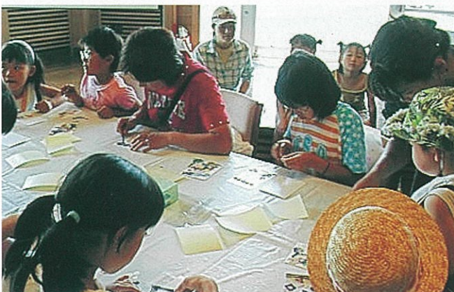
押し花ハガキ&しおり体験