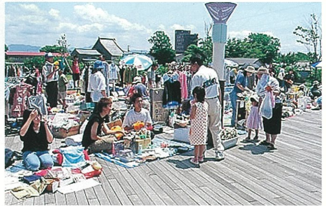
フリーマーケット