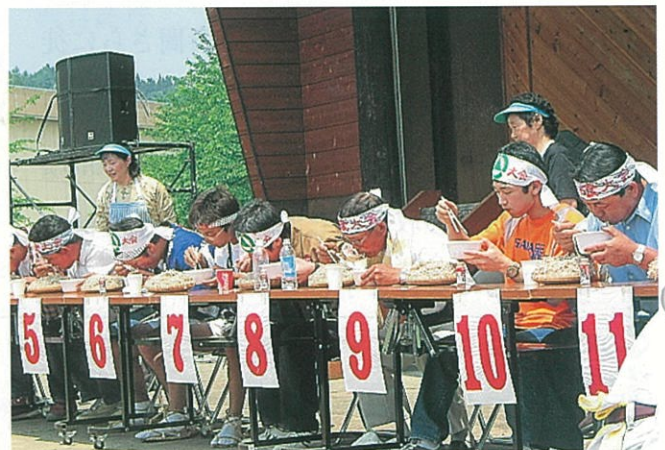
百宅そば早喰い大会