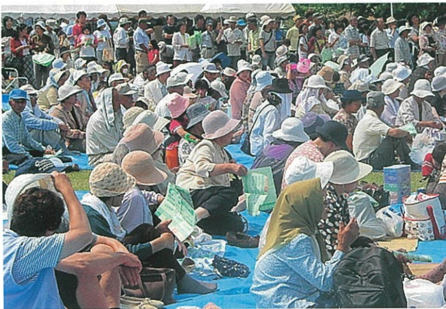
さなぶり大抽選会