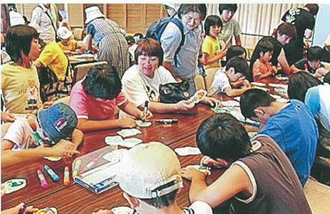
つくってあそぼう「キーホルダー」