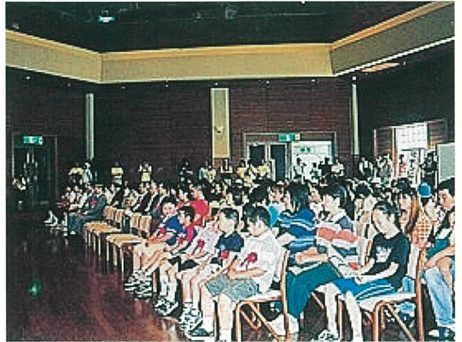
開 会 式