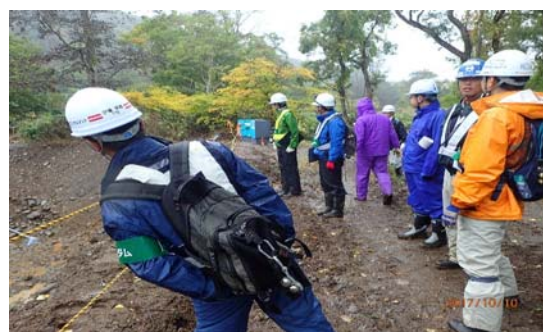
▲材料調査による掘削箇所を確認