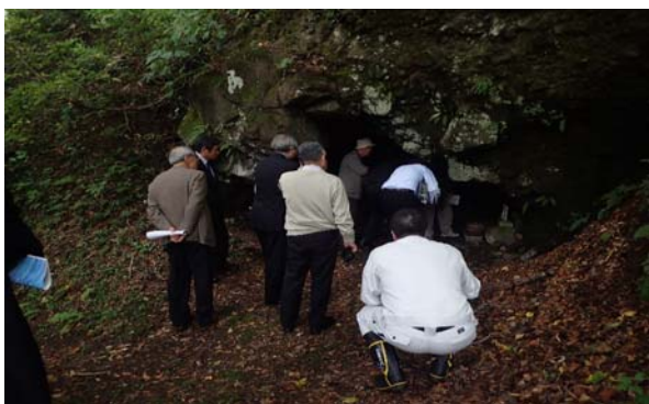
▲弘法洞穴を視察する委員