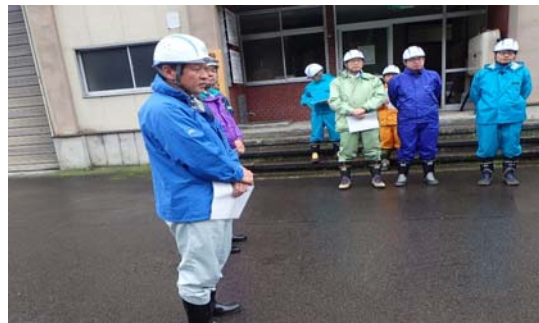
▲開会で挨拶する長内事務所長