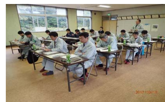
▲検討会で点検結果について意見を述べる職員