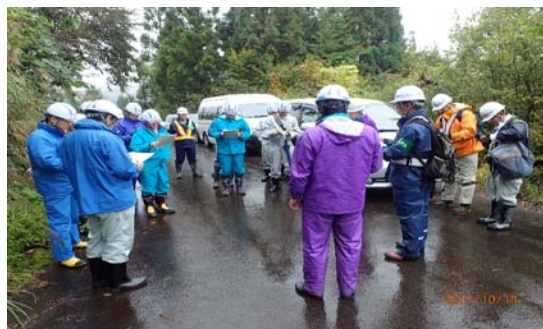
▲現場責任者からの現場説明状況