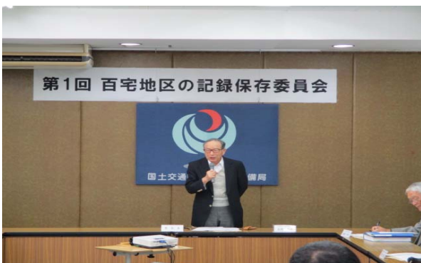
▲互選により選出された富樫委員長の挨拶