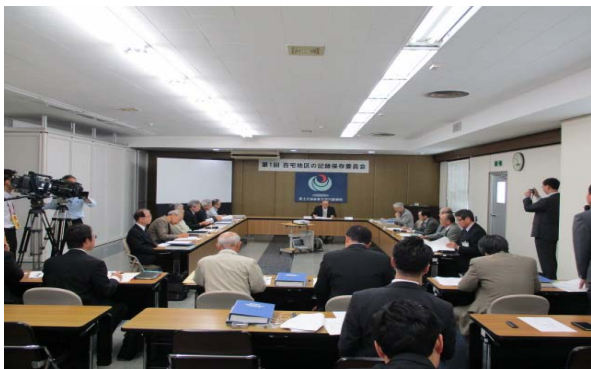
▲「百宅地区の記録保存委員会」の状況

今後、委員の協力を得て、より良い記録保存が出来るよう編さんを進めて参りますので、関係者の皆様のご理解とご協力をよろしくお願い致します。