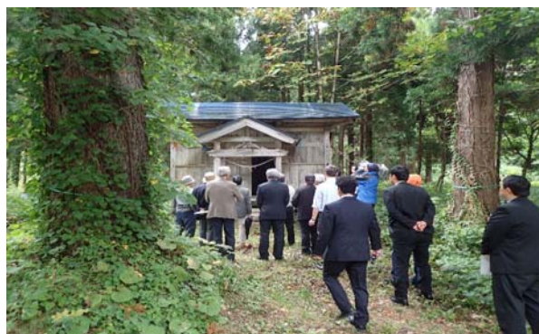
▲百宅地区内の神社を視察する委員