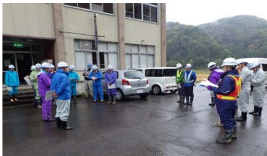
▲安全パトロール開会の状況