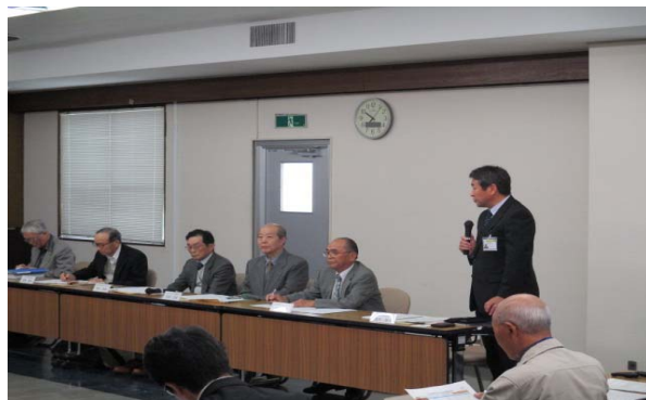
▲長内事務所長による挨拶