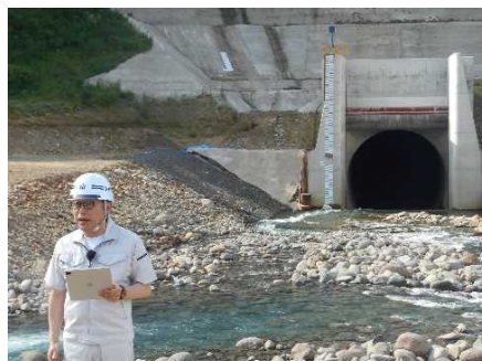
転流工呑口側での撮影