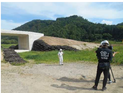
市道の立体交差箇所での撮影

当日は快晴で由利本荘市内は気温がとても高い日でしたが、鳥海ダム工事現場付近では時よい心地よい風が吹いていました。