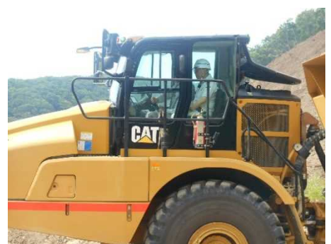
40t重ダンプトラック試乗

その後、湊市長は市道の立体交差(重ダンプトラックが通行するためのボックスカルバートを設置しその上を一般車両が通行)、転流工呑口側、鳥海ダム展望所を巡られリポートをされていました。