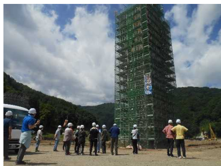
4号橋橋脚での説明