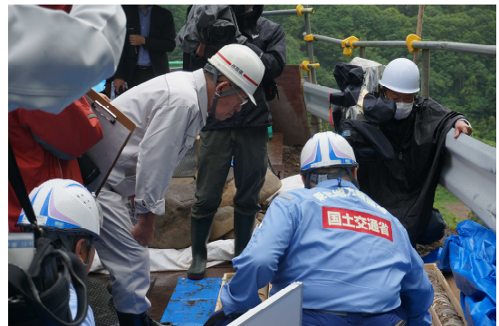
ダムサイトでの視察