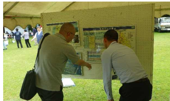
鳥海ダムコーナー