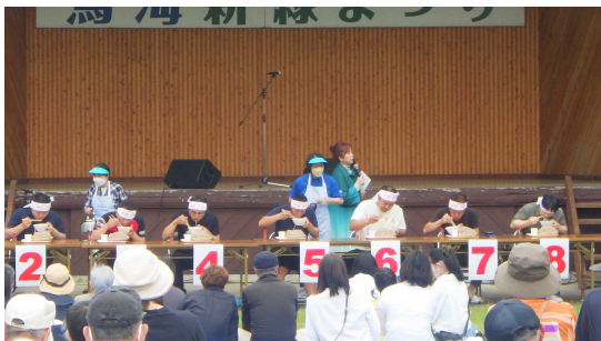
百宅そば早食い大会

当日は、地域住民の方が多数参加され、恒例の「百宅そば早食い大会」や「さなぶい抽選会」等で大いに盛り上がりました。