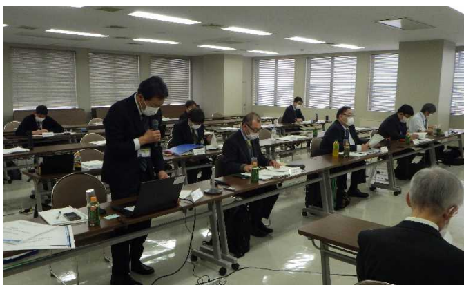
事務局による調査結果の説明