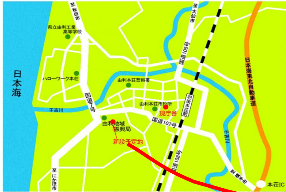
庁舎新設予定地位置図