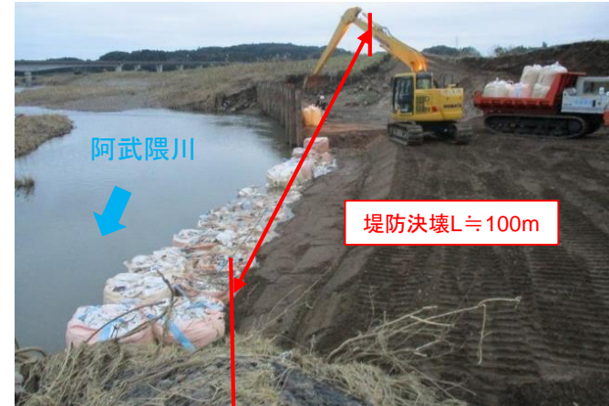
あぶくま あぶくま にしらかわぐんやぶきまちなかおき ⑭阿武隈川水系阿武隈川 福島県西白河郡矢吹町中沖地先 被災状況