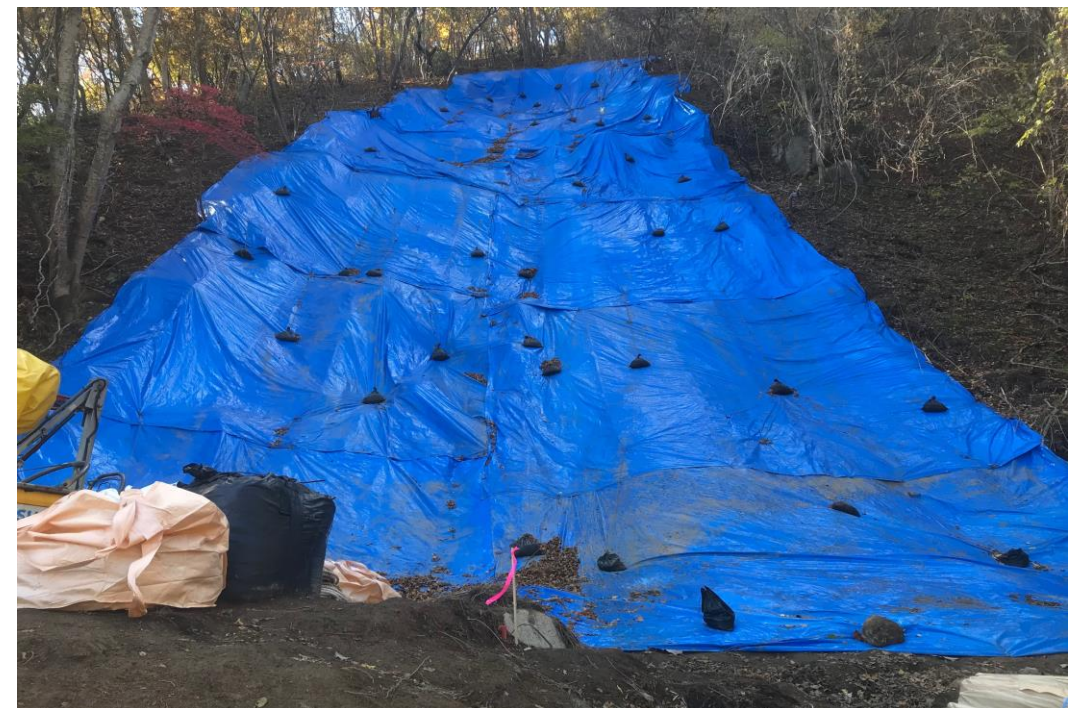
相馬福島道路(9.75kp(下り)) 2019.11.21 6時00分 侵食防止シート設置完了