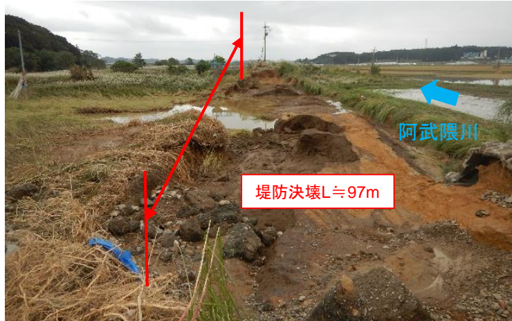
あぶくま あぶくま いわせぐんかがみいしまちかわら ①阿武隈川水系阿武隈川 福島県岩瀬郡鏡石町河原地先 被災状況