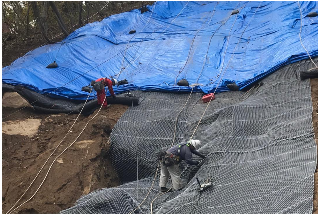
相馬福島道路(9.75kp(下り)) 2019.11.16 11時00分 侵食防止シート設置作業状況