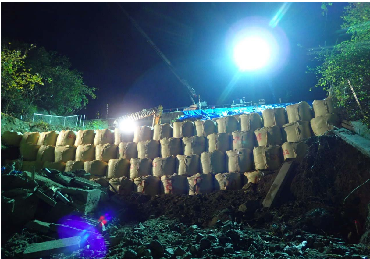
相馬福島道路(8.43kp(下り)) 法面崩落箇所 応急復旧工事状況 令和元年11月13日 4:00頃