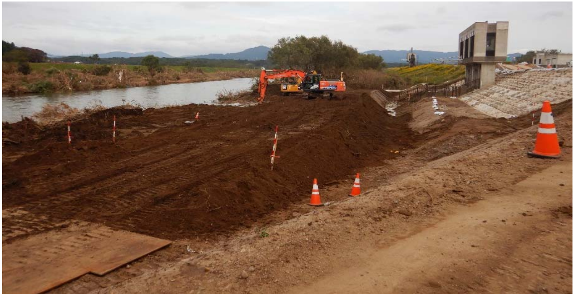
令和元年10月24日午後 鋼矢板施工ヤード造成状況