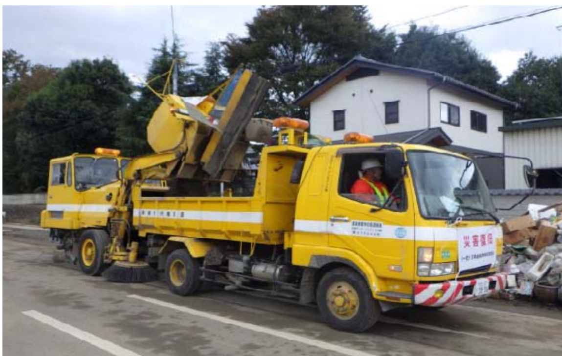
令和元年10月24日 路面清掃車からダンプへの撤去土砂積込状況