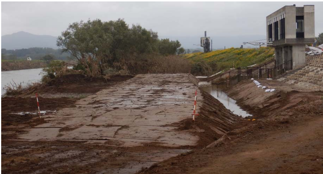
令和元年10月25日早朝 鋼矢板施工ヤード造成完了