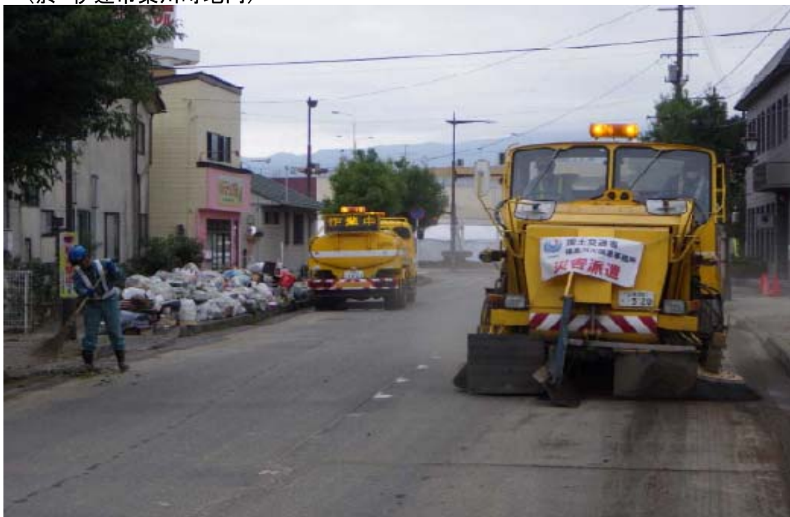
令和元年10月24日 路面清掃車と散水車による作業状況

災害対策車両による、伊達市梁川町地内に流入した土砂の撤去作業実施状況 (於 伊達市梁川町地内)