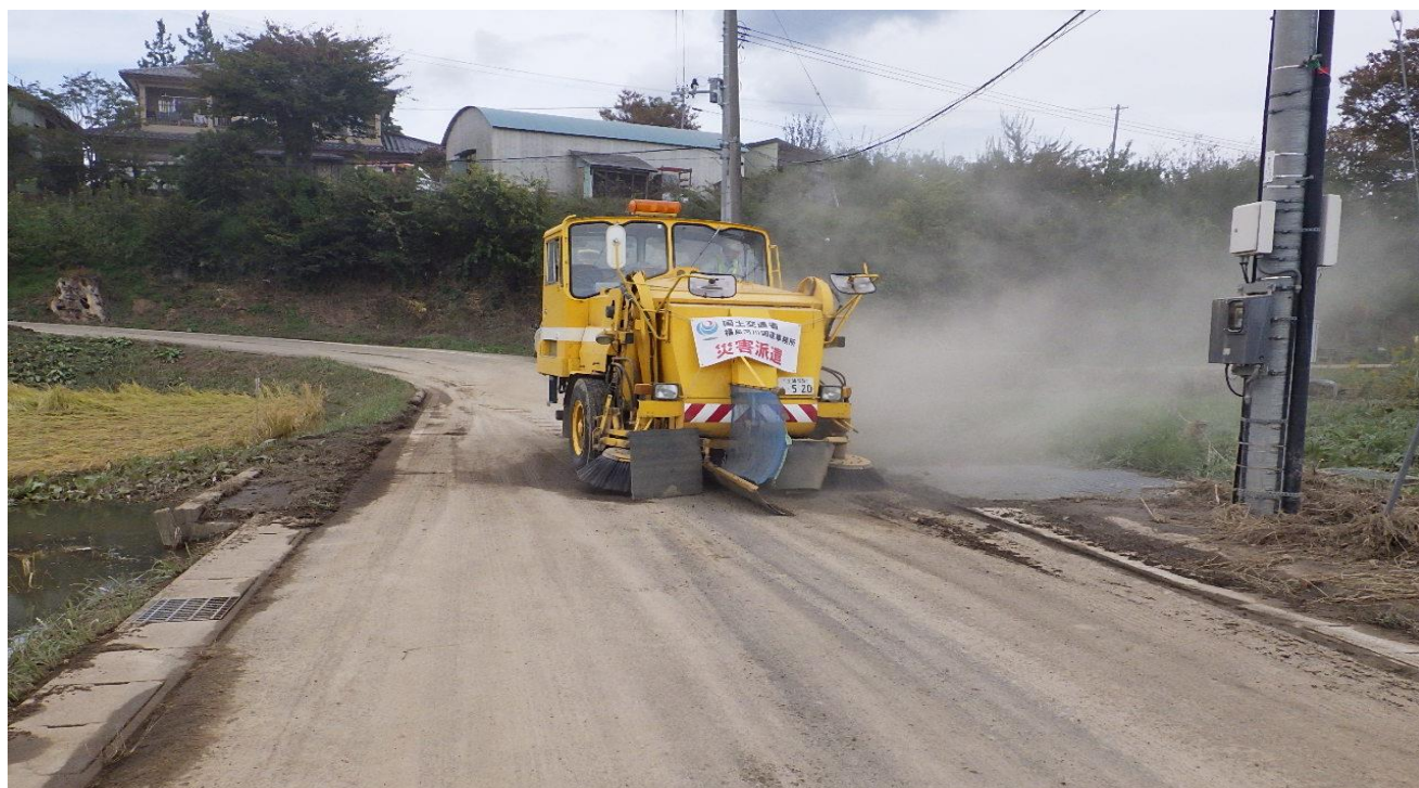
災害対策車両による、国見町内に流入した土砂の撤去作業実施状況 令和元年10月19日(写真上)、10月20日(写真下) (於:伊達郡国見町地内)