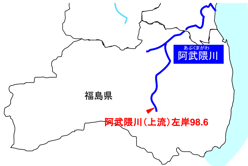
阿武隈川(上流)左岸98.6k 福島県須賀川市浜尾地先