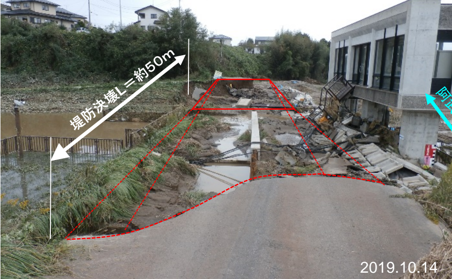
【阿武隈川左岸98.6K 決壊箇所】