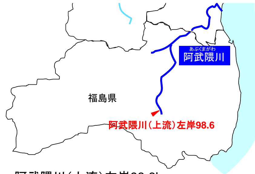
阿武隈川(上流)左岸98.6k 福島県須賀川市浜尾地先