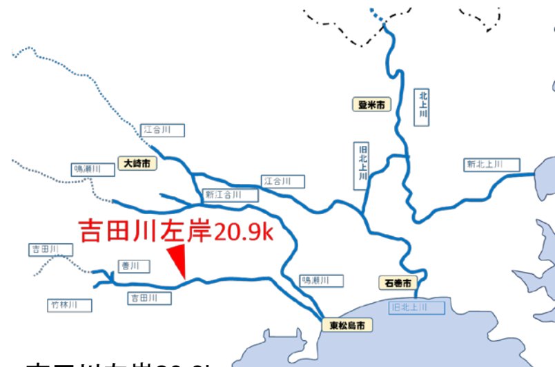
吉田川左岸20.9k 宮城県黒川郡大郷町粕川字田三郎地先