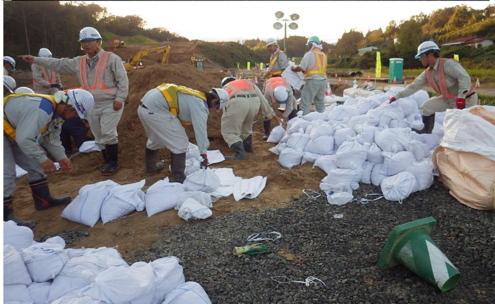
【自治体支援】 福島市北信支所への土のうの搬入状況・土のうの製作状況 令和元年10月16日