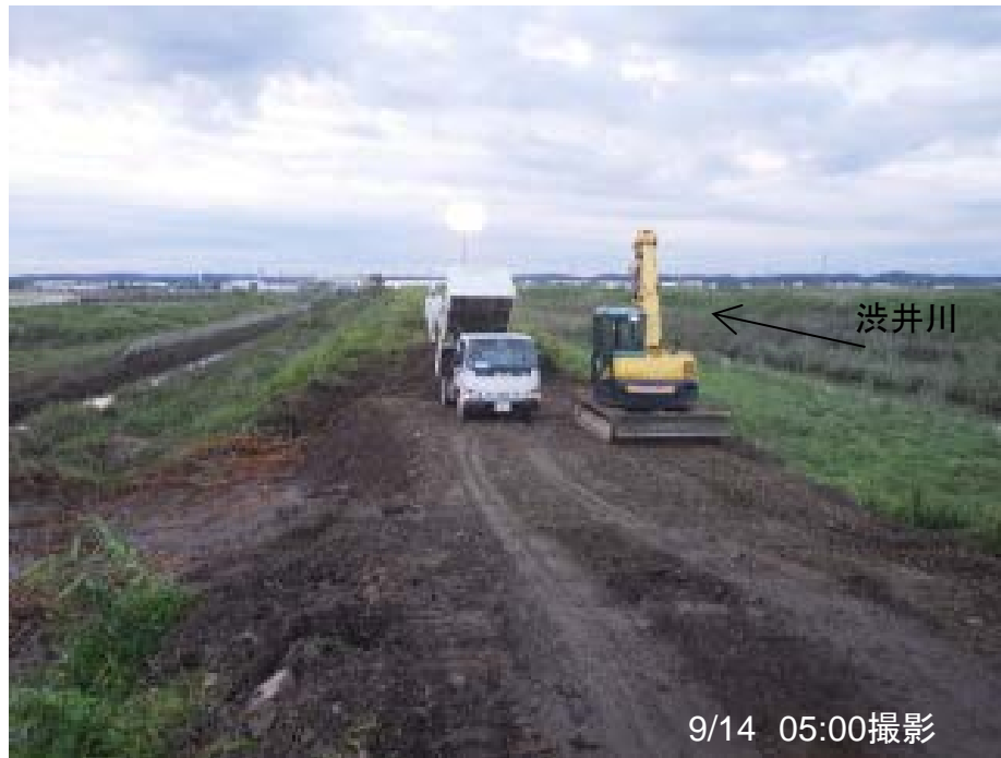
西荒井中流工区 復旧状況