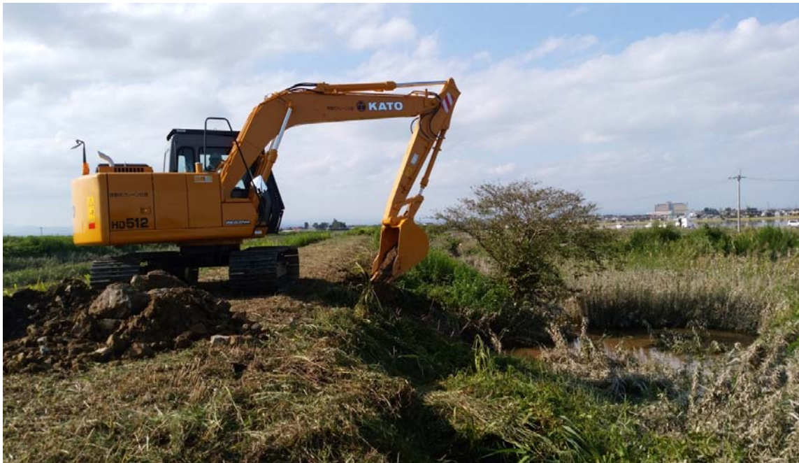
9月12日15時30分 堤防法くずれ箇所補修状況