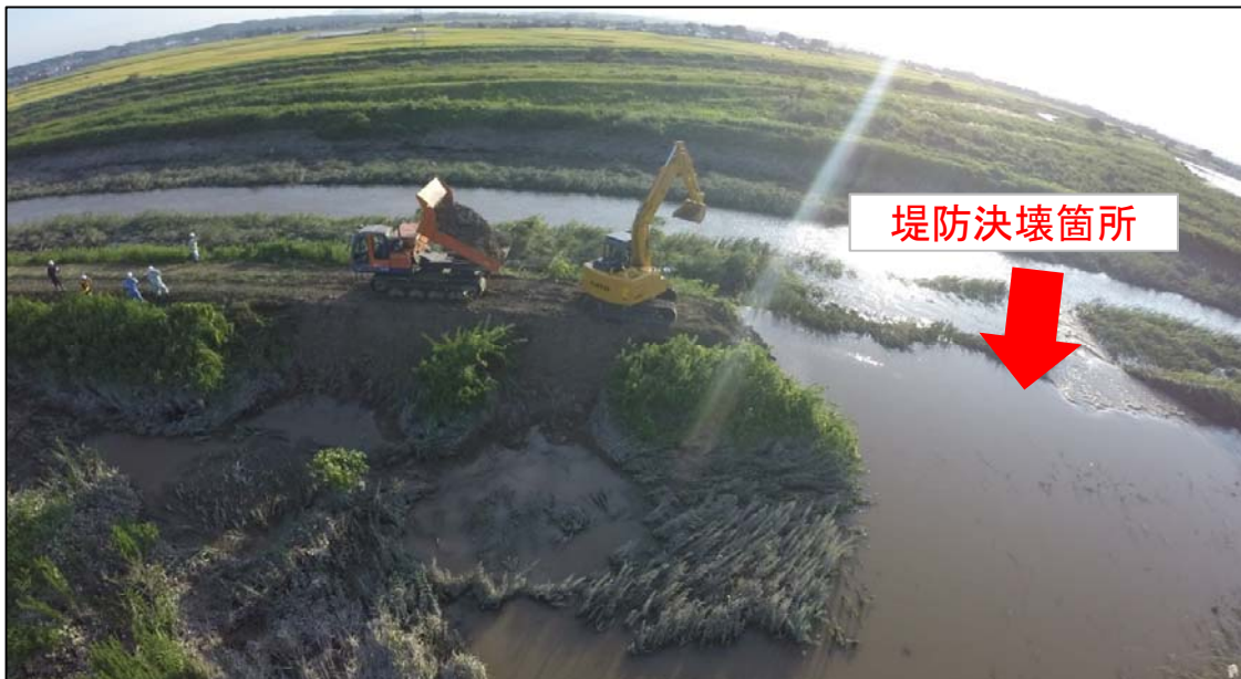
9月12日16時20分 堤防決壊箇所の補修状況