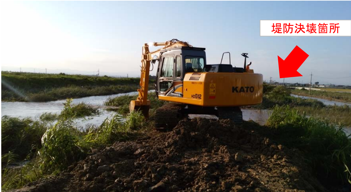
9月12日16時20分 堤防決壊箇所の補修状況