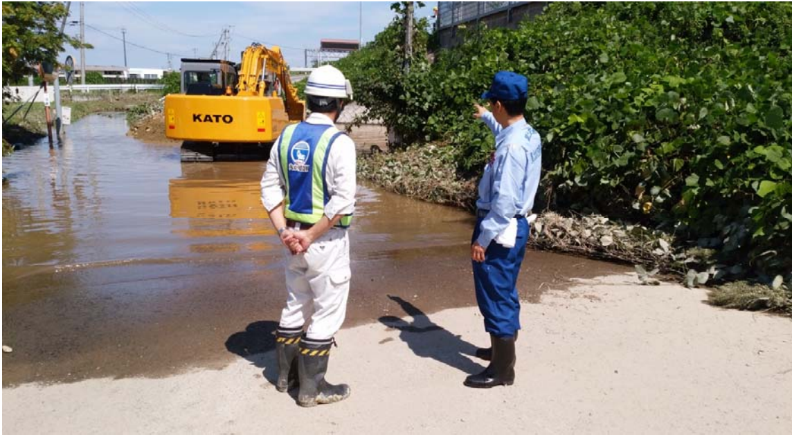
9月12日10時00分 工所用道路造成状況