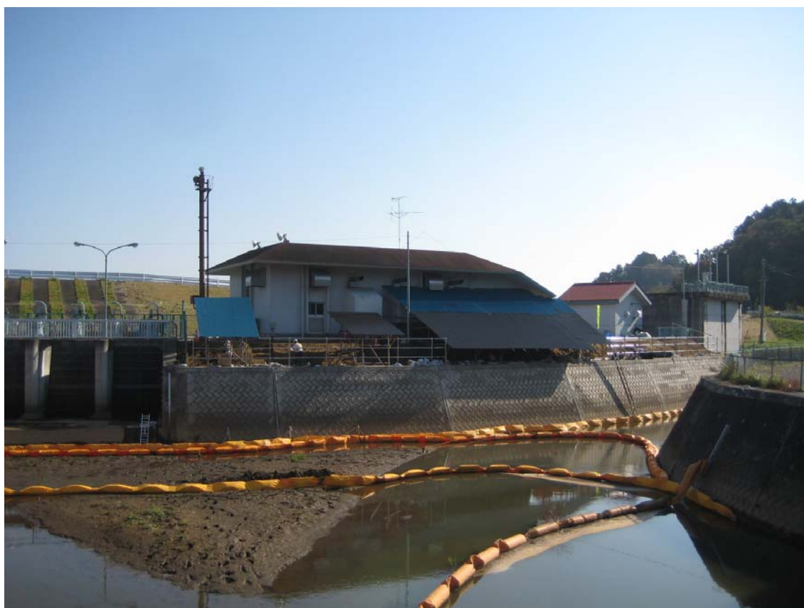
雨除け屋根 の設置