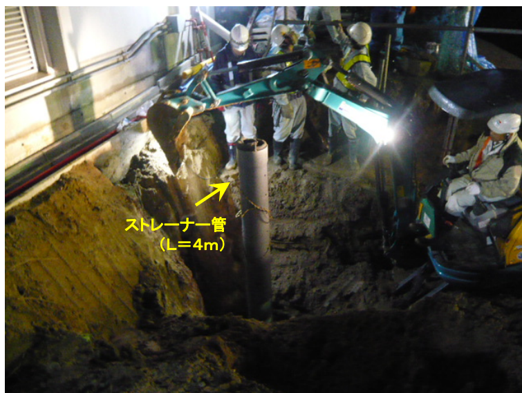
土砂掘削及びストレーナー管設置状況