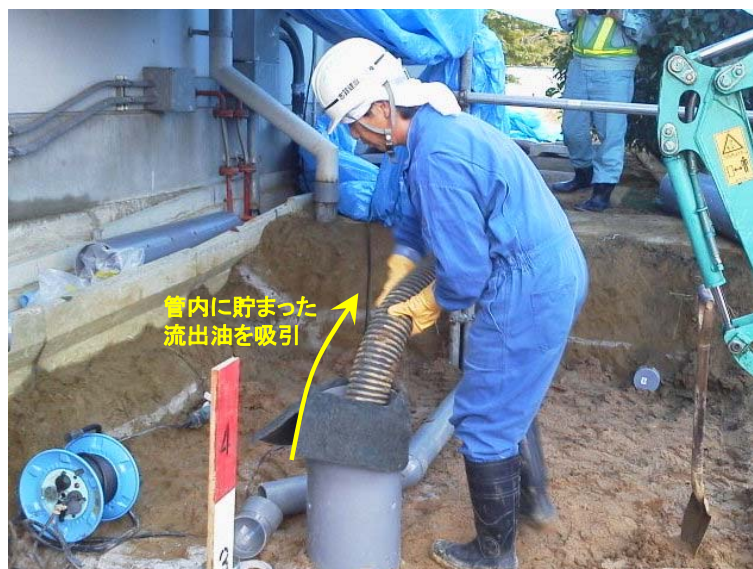
流出油の回収作業状況