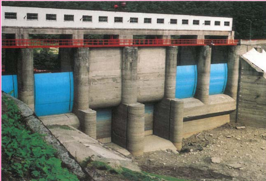
平成6年8月の渇水状況