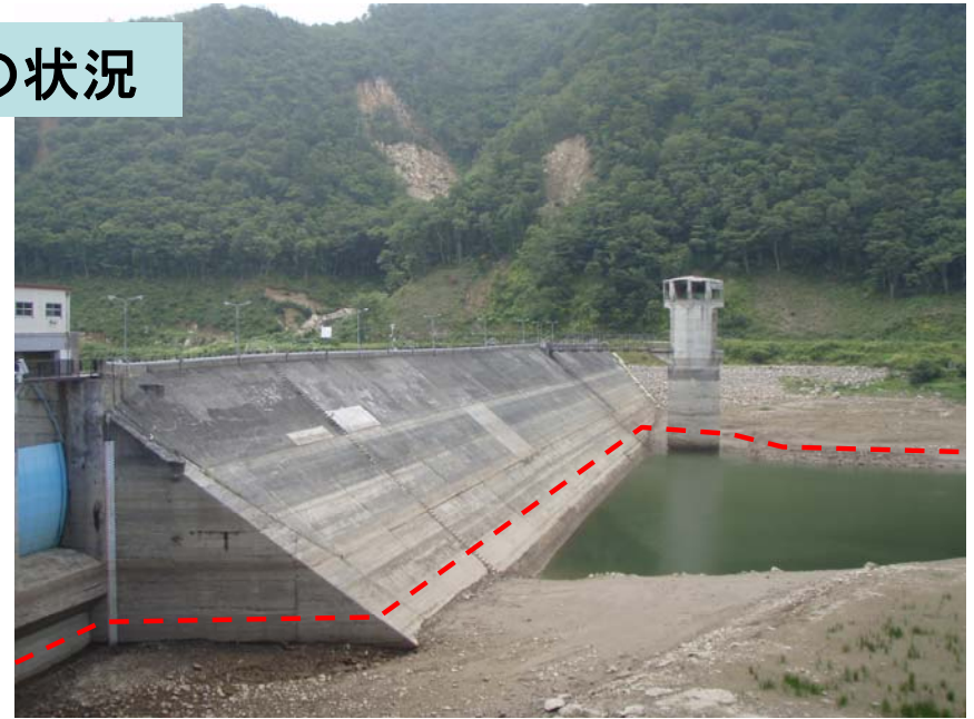
8月20日9時頃撮影 貯水位303.4m