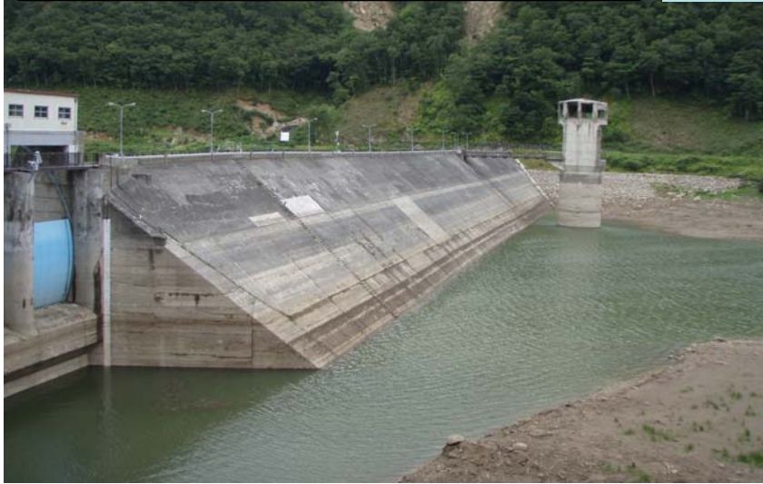
8月14日9時頃撮影 貯水位306.6m