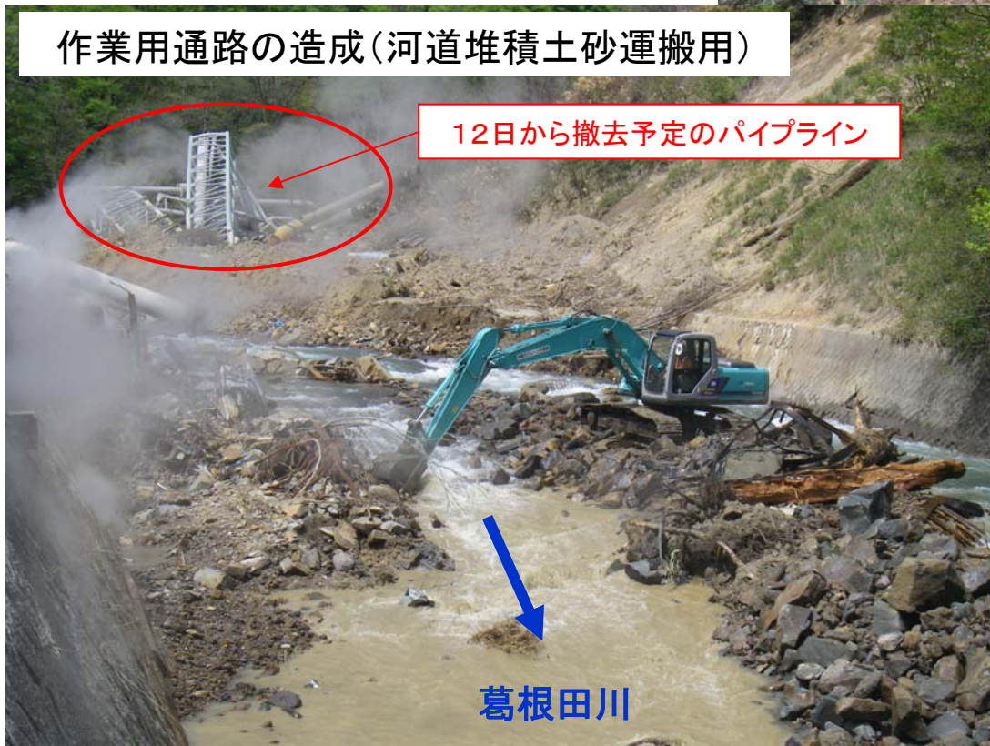
12日から撤去予定のパイプライン