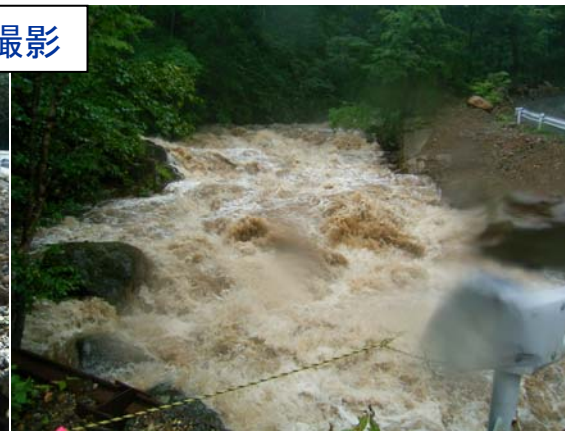
出水中 平成18年8月18日15時