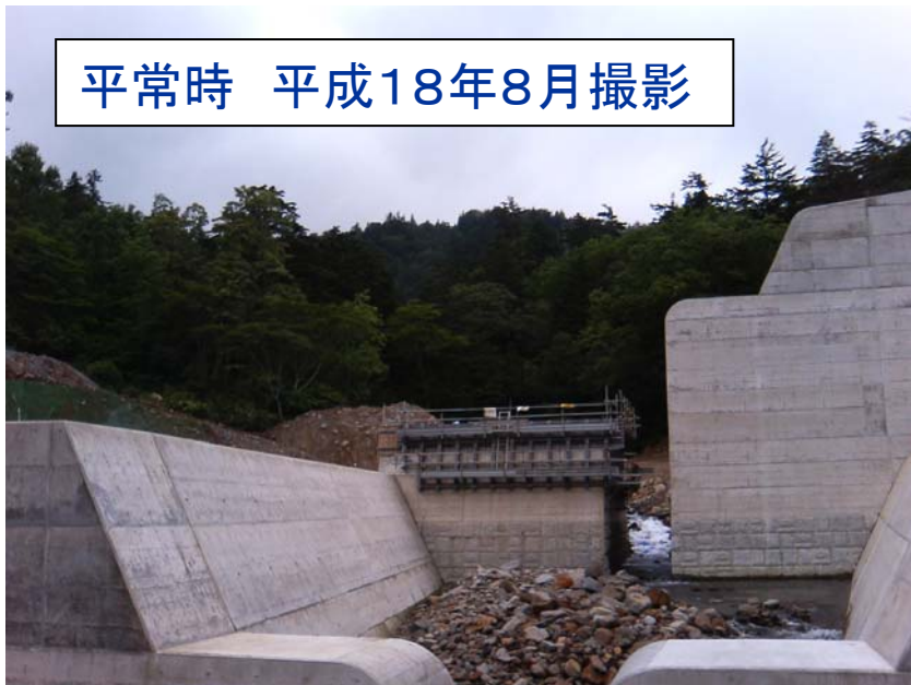
平常時 平成18年8月撮影