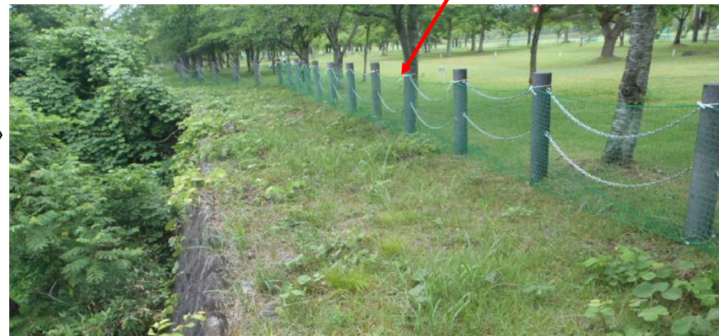
新たに設置した安全ネット