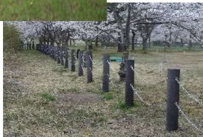
急な法面が接近しているチェーン式防護柵の隙間が大きい。 小さな子供が防護柵をくぐると、すぐに危険な急斜面に接近