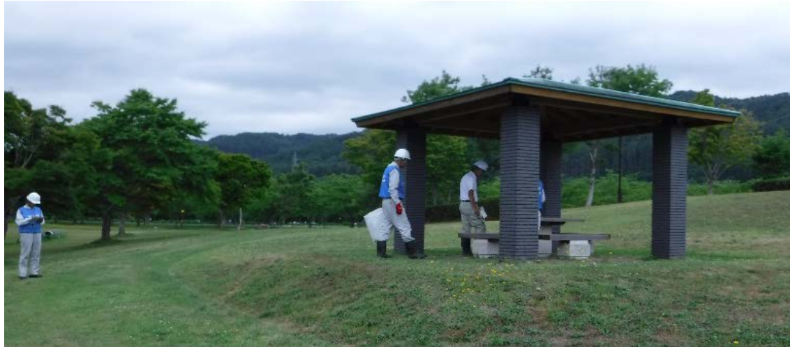
七ヶ宿ダム自然休養公園の東屋を七ヶ宿町及びNPO、公園管理者と合同で点検を実施。