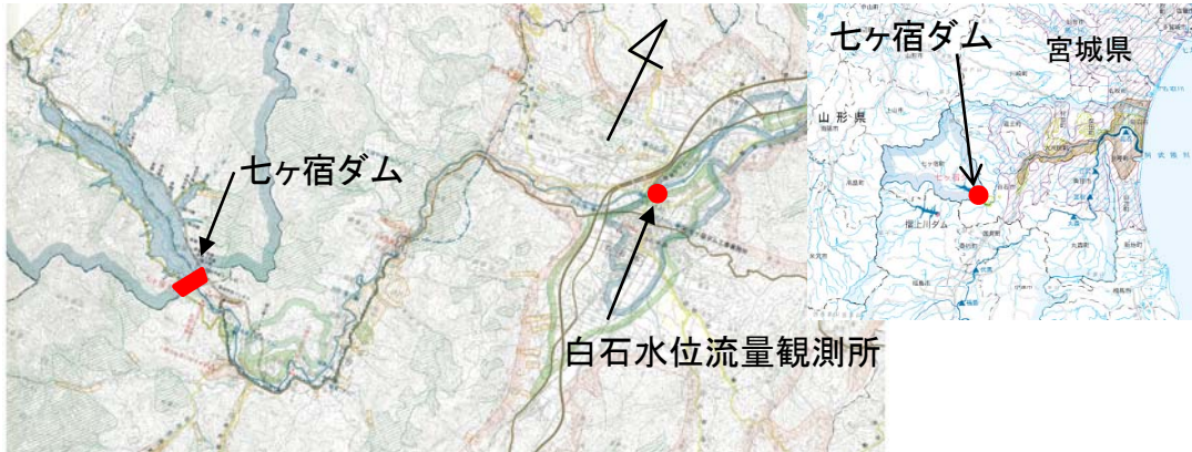
位置図 白石水位流量観測所

○七ヶ宿ダムの洪水調節によって、下流の白石市(白石市半沢屋敷地先)では、0.32mの水位を低減させる効果があったものと推測されます。