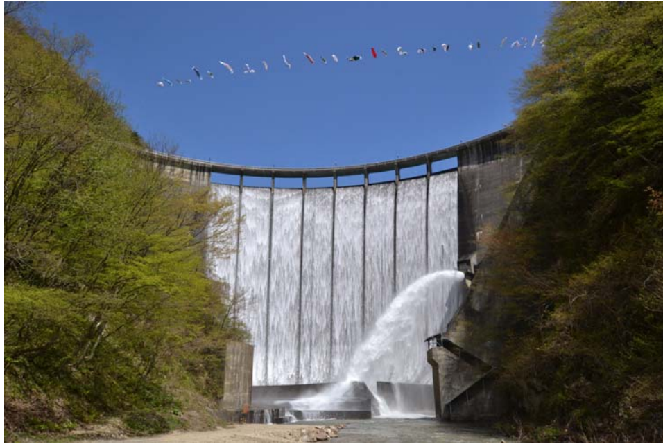
(平成29年5月2日 12時頃撮影)