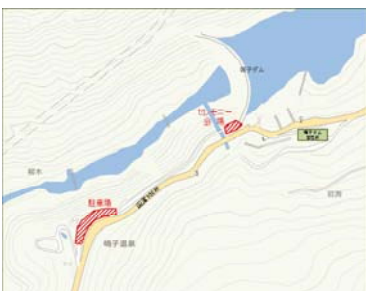
オープニングセレモニー会場