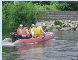
船による河岸の情報収集等