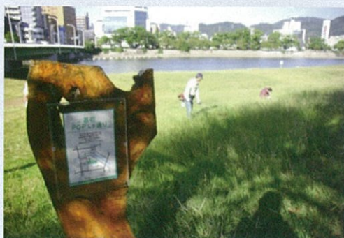
市民団体による看板設置事例（太田川）

これらの河川法上の許可等について、河川管理者との協議の成立をもって足りることとなります。