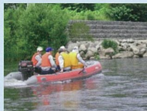
船による河岸の情報収集等