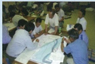
マイ防災マップづくり