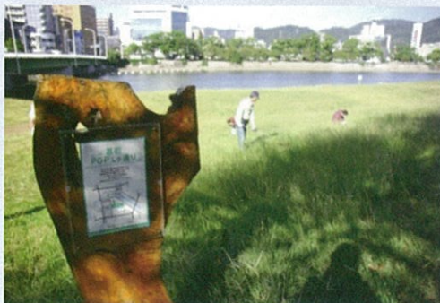
市民団体による看板設置事例（太田川）

これらの河川法上の許可等について、河川管理者との協議の成立をもって足りることとなります。