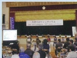
シンポジウムの開催