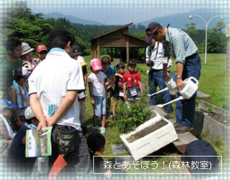
森とあそぼう！（森林教室）