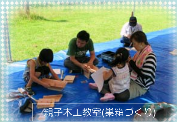
親子木工教室(巣箱づくり)