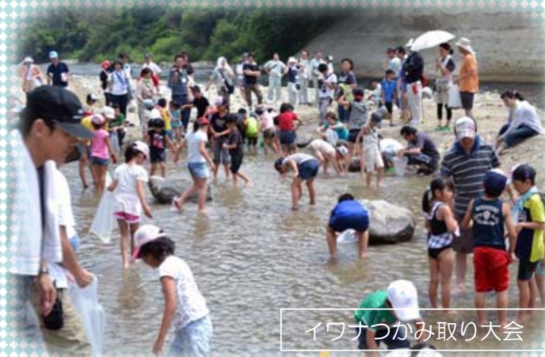
イワナつかみ取り大会