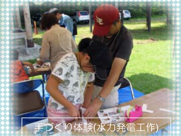
手づくり体験(水力発電工作)