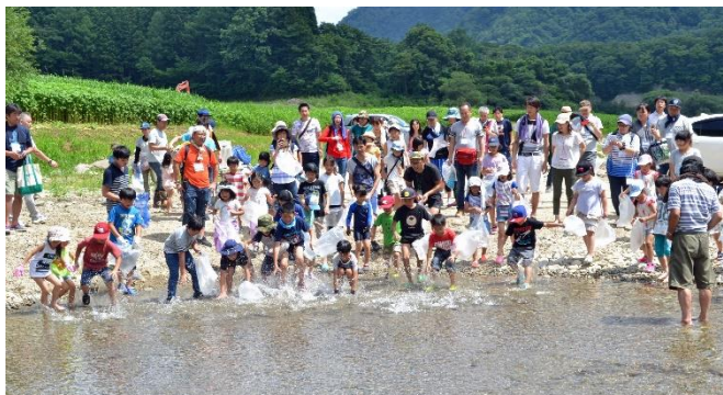
あつまれ鳴子ダム2019 イワナつかみ取り実施状況

○このイベントは、国土交通省と林野 庁との共同行事「森と湖に親しむ旬 間(7/21～31)」並びに地域の活性化 推進事業「鳴子ダム水源地域ビジョ ン」の対象行事です。