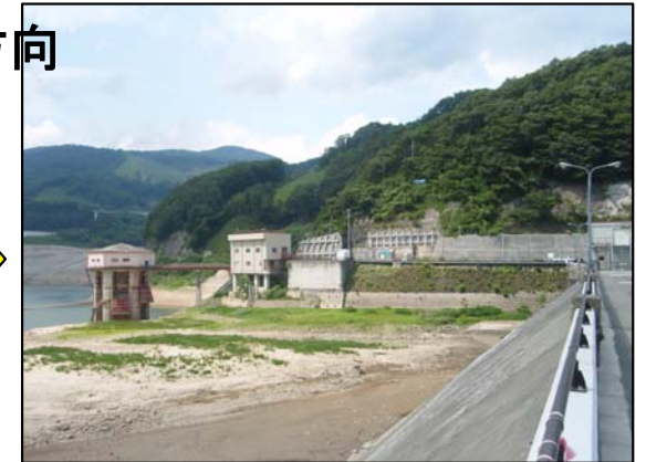
8月15日 13時30分頃撮影 貯水位304.2m