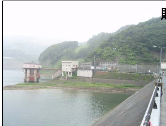
7月20日 11時頃撮影 貯水位309.3m