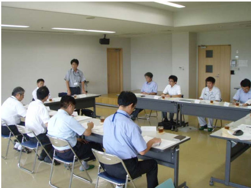
石淵ダム利水連絡会の様子(7/29)