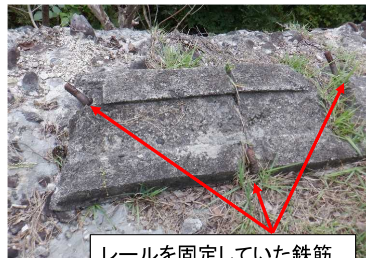
レールを固定していた鉄筋も一部残っています