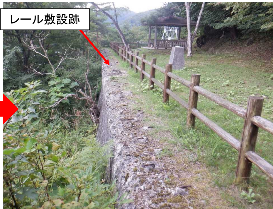
現在の状況(展望広場)