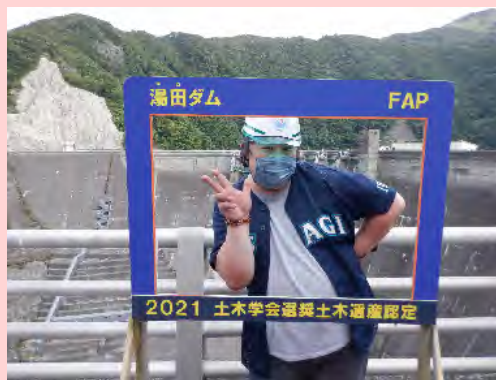
道の駅 錦秋湖の名物店長さん

湯田ダム建設時にも大きな協力をいただいた西和賀町のみなさまに感謝し、今後も適切にダム管理をしてまいります。