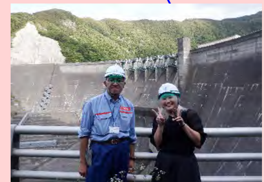
西和賀町地域起こし協力隊さん