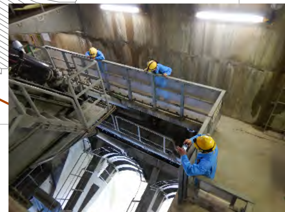
コンジットゲート室