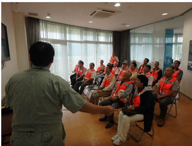
ものしり館で概要説明

「ダムから放流した水は花巻まで何時間位で到達するのか」など質問があり、防災の意識の高さが感じられました。