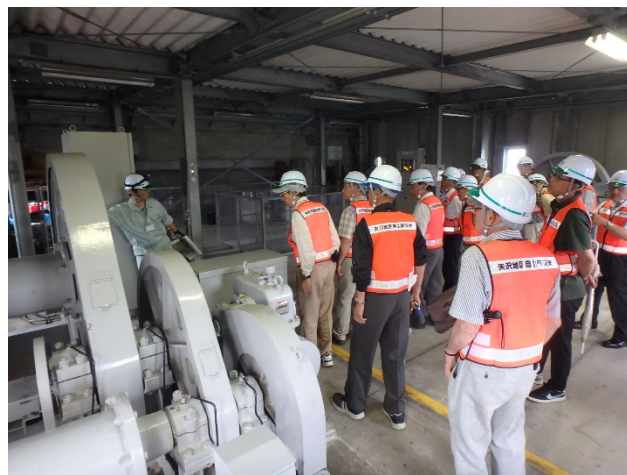
ゲートハウス見学