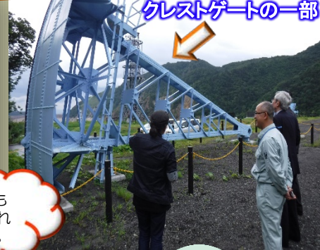
クレストゲートの一部