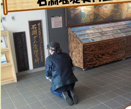
石淵堰堤史料室にて