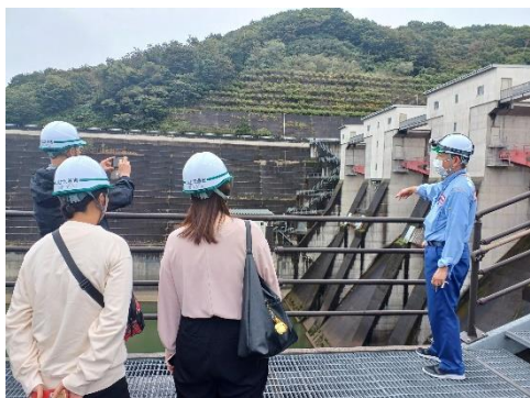
ダムのすぐ脇でゲートの説明