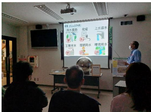
ものしり館でダムの役割などをご説明しました

ごしょこものしり館でダムの役割の説明をした後、監査廊や堤体の上をご案内しました。監査廊内の説明書きなども興味深く眺めていました。